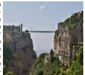
Pont de Sidi Mcid, Constantine