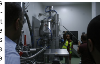
Salle de mélange des matières premières

validation des pesées avec des équipements de pointes. L'ensemble des opérations se fait sur la base d'un système de documentation comportant les spécifications, les formules de fabrication, les instructions de fabrication et de conditionne-